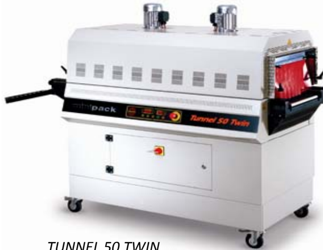
TUNNEL 50 TWIN