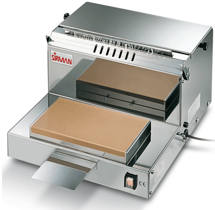
Sirman Горячие столы , model Dispenser 40 M :

Sirman Spa Viale dell'Industria 9/11 35010 PIEVE DI CURTAROLO (PD), Italy Tel./Fax. +39 049 9698666 / +39 049 9698688 email: info@sirman.com